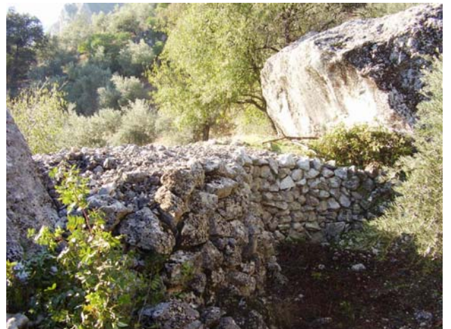
Foto 1 y 2. Vista de un lindero y una albarrada.