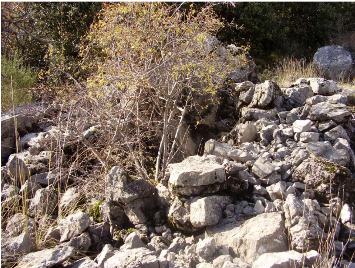
Foto 1. Vista general de la choza.

Dato: Ortofoto digital de Andalucía. E= 1:5.000