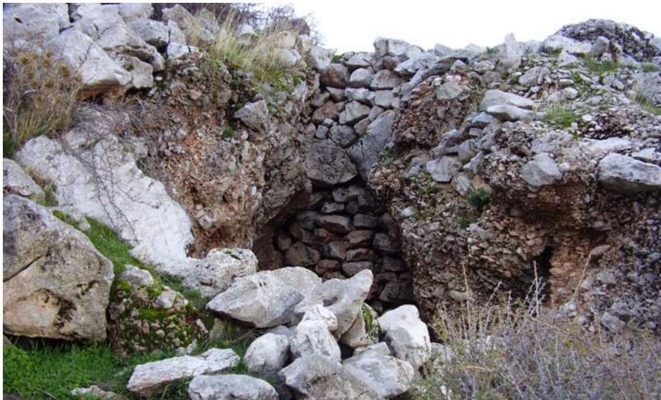
Foto 1. Vista de la choza.