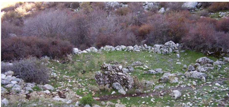
Foto 2. Vista del corral.