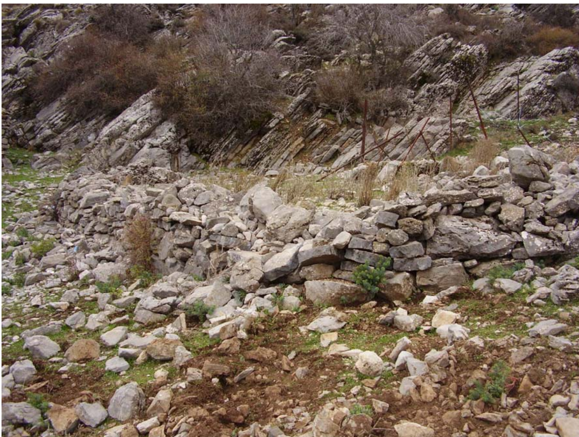
Foto 1. Vista de la albarrada del corral.