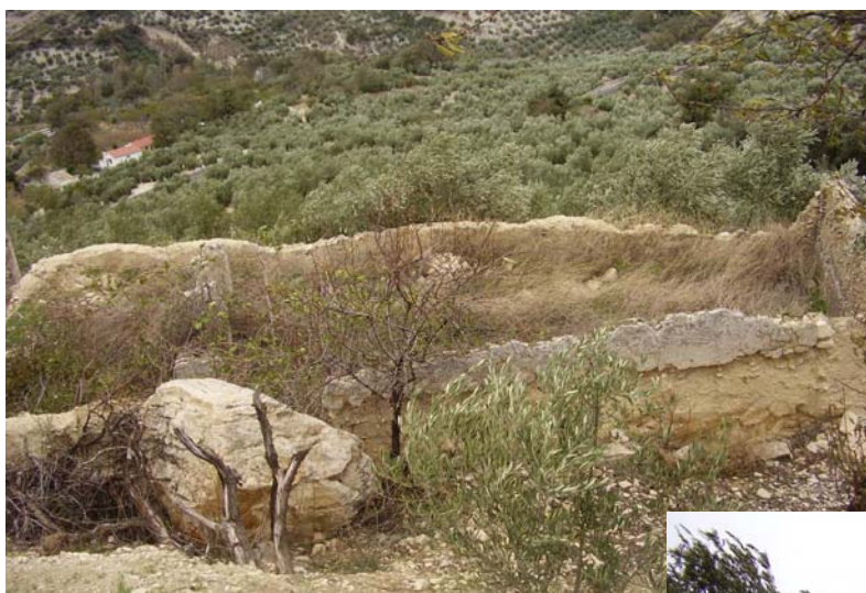
Foto 1. Vista del corral.

Dato: Ortofotografía digital de Andalucía. E= 1:2.500