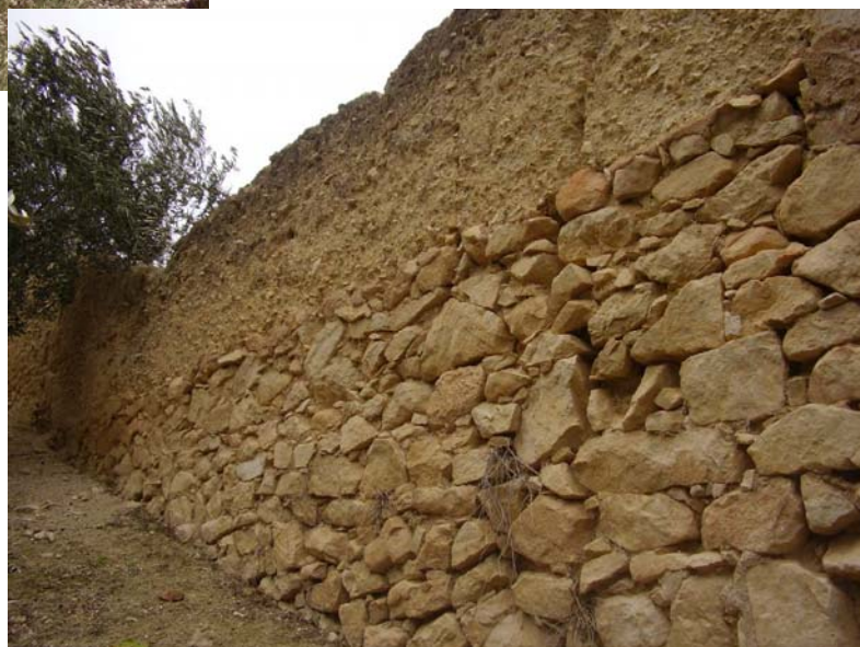
Foto 2. Vista de la pared Norte.