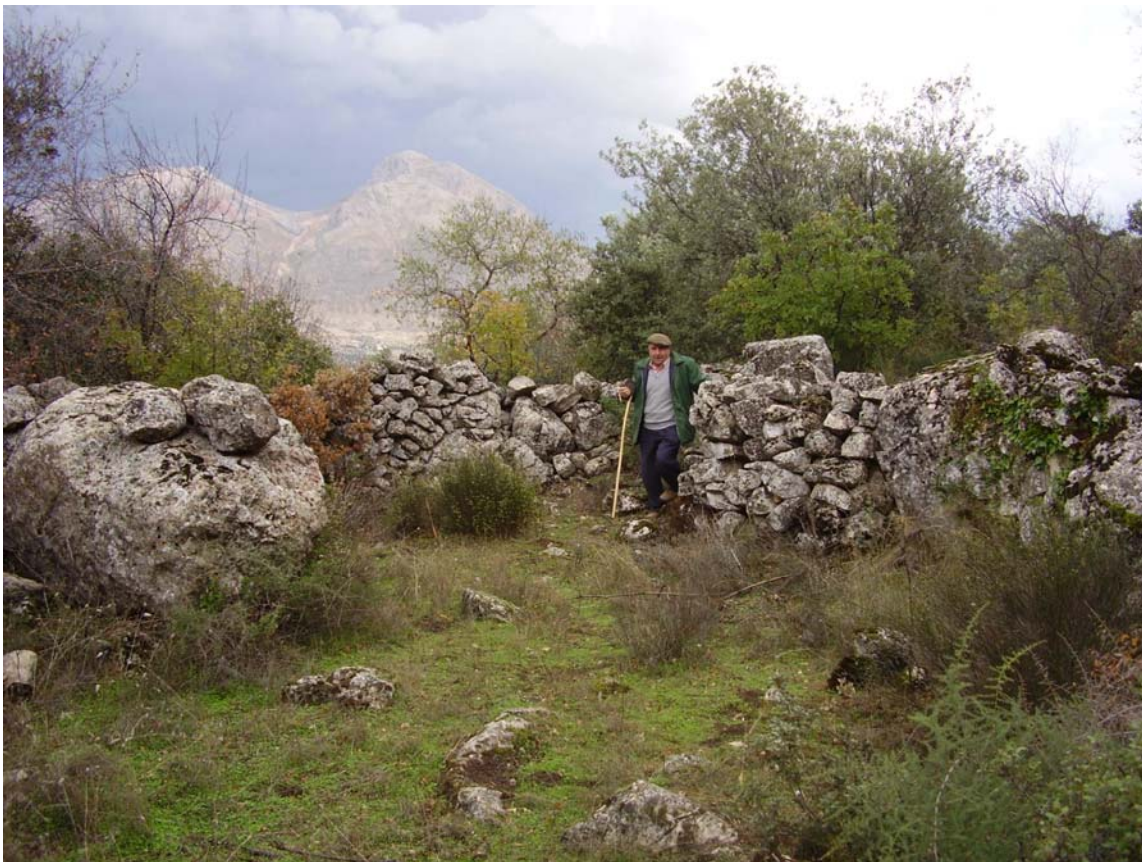
Foto 1. Vista parcial del corral.

Dato: Ortofoto digital de Andalucía. E= 1:4.500