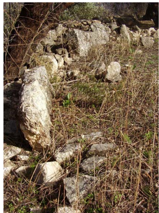
Foto 2. Detalle de las piedras dispuestas en el contorno de la era.