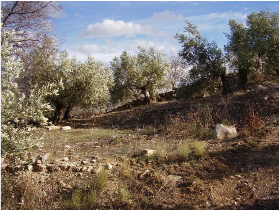
Foto 1. Vista de la era.

Dato: Ortofoto digital de Andalucía. E= 1:1.500