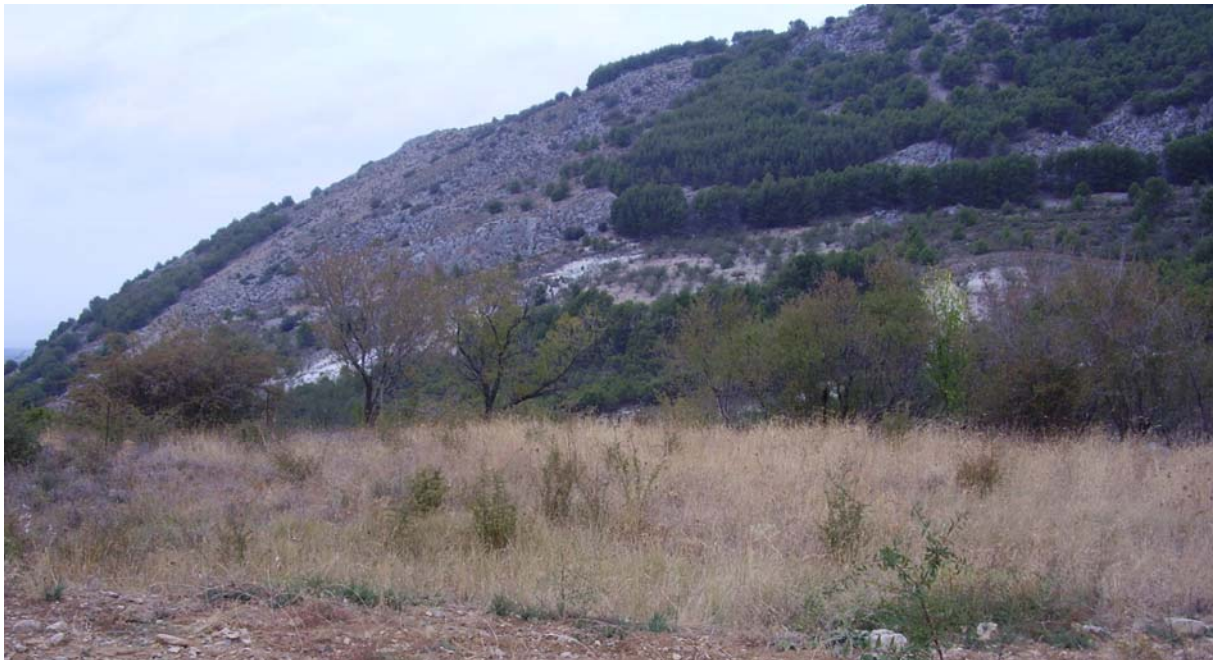
Foto 2: Vista de la general de la era, al fondo el Cerro de la Vieja.