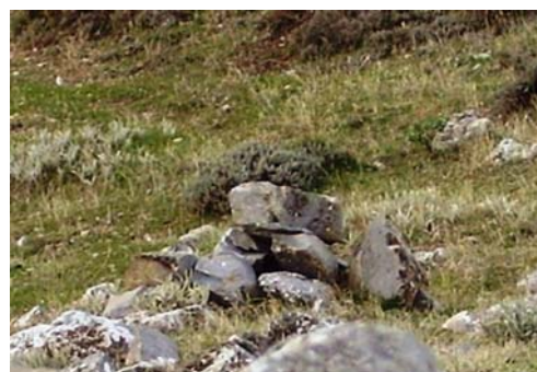
Foto 2. Repostero del puesto.