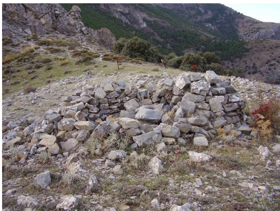
Foto 1. Vista de puesto de cuco.

Dato: Ortofoto digital de Andalucía. E= 1:4.000