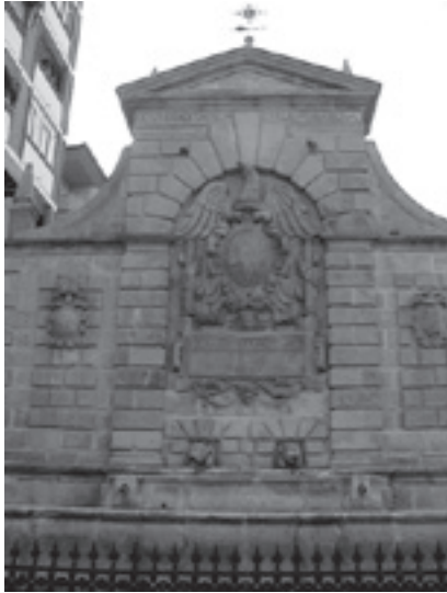
Fuente Nueva - Martos