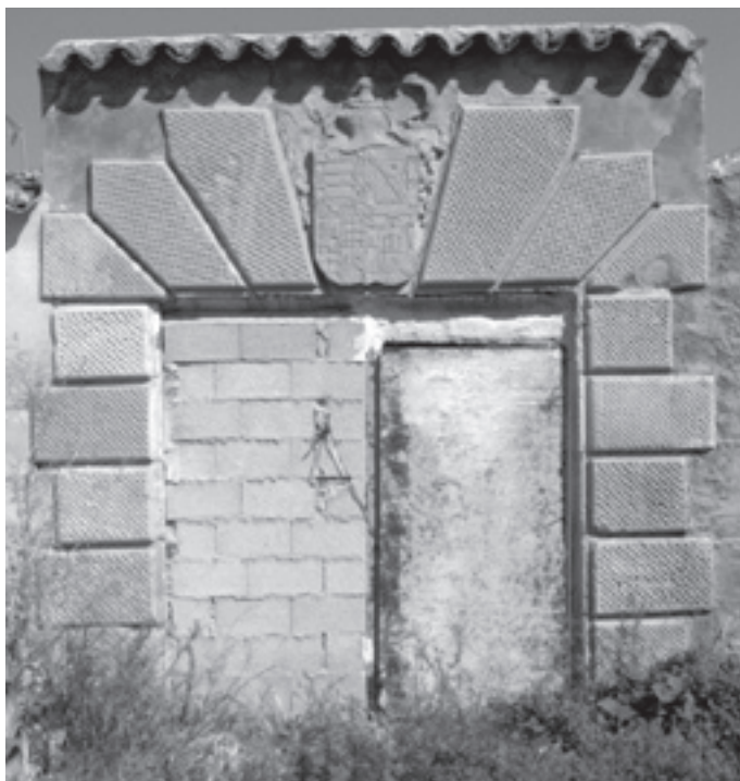
Portada del antiguo cortijo de La Torre en su emplazamiento actual

Las jambas están formadas cada una por seis bloques de piedra colocados a soga y tizón y el dintel lo forman siete dovelas realizadas, siendo la clave la de mayor tamaño.