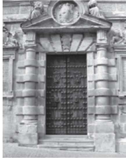
Portada del Ayuntamiento de Martos