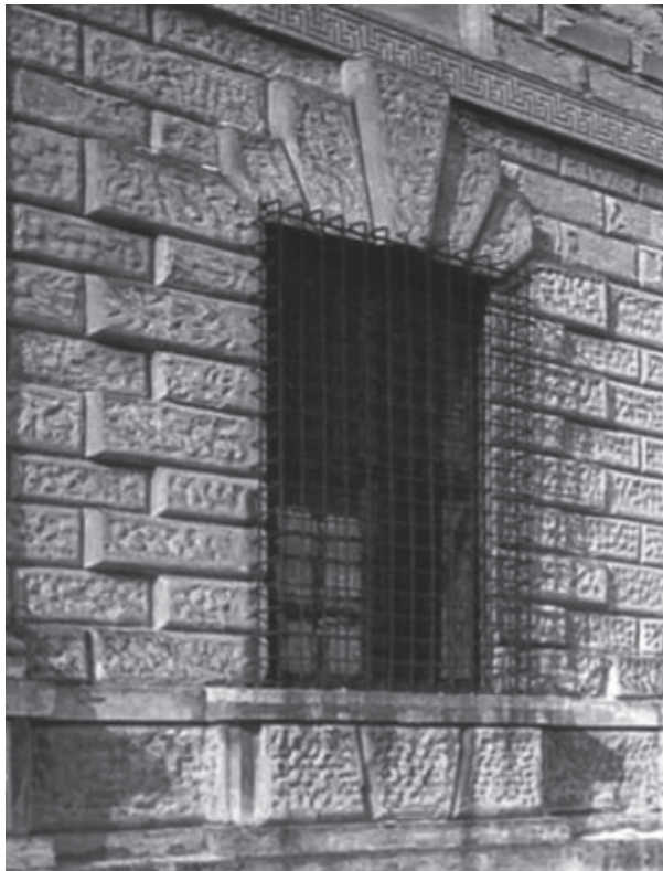
Detalle Palacio del Te – Giulio Romano

ción iconográfica muy del gusto renacentista, solución iconográfica, que termino por suscitar recelos eclesiásticos por su relación con el maligno y que fue explícitamente condenada por el papa Urbano VII en 1628.