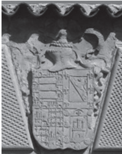
Escudo de la familia: Messias, Ponce de León, de la Cerda Carrillo