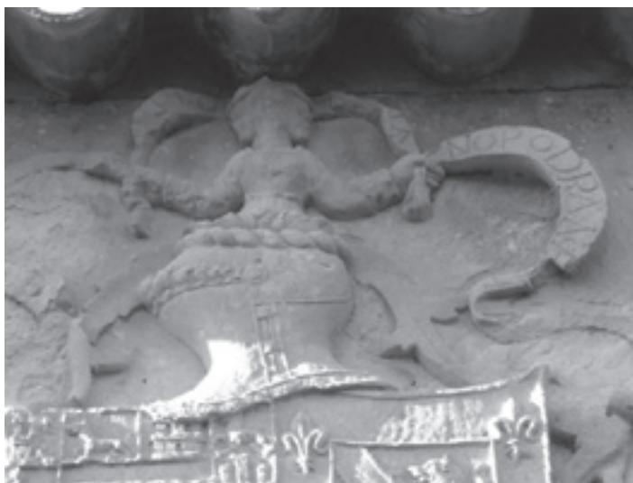
Detalle de la cimera del escudo

1º Es una rara muestra de arquitectura civil rústica, pues si bien este tipo de portadas son relativamente frecuentes en núcleos urbanos, resultan francamente escasas en zonas rústicas, quedando claro el interés de su propietario, probablemente, don Gonzalo Messia Carrillo, futuro marqués de La Guardia, en lucir su blasón junto al camino de Jaén a Granada en una clara ostentación de su rango y fortuna.