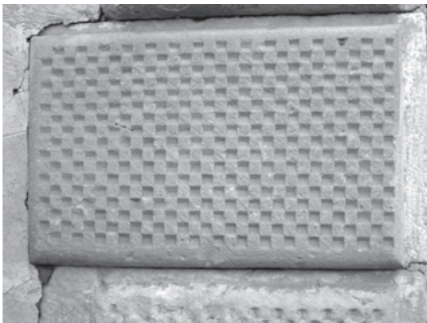
Detalle del abovedado y ajedrezado de una de las piezas de las jambas. Sera pues en esta portada, donde el joven arquitecto ensaye algunos elementos que luego más tarde incorporara a muchas de sus obras.

Además en esta obra que considero realizada por Castillo al poco tiempo de regresar de Italia, se produce un enfrentamiento entre el quiero y el no puedo, pues si bien el autor al aceptar el encargo, apuesta por la nuevas corrientes estéticas, sin embargo se ve en la obligación de complacer el gusto de su mecenas y de este modo incorpora a la obra elementos ya en desuso, como es el caso de los grandes blasones muy característicos de las portadas del siglo XV, así mismo se ve en la obligación de suavizar las formas del llamado estilo rustico tal vez difíciles de asimilar por su mecenas, por unas formas que sin dejar de serlo resulten menos llamativas y así de este modo suaviza el volumen de los almohadillados y transforma el tratamiento rustico de su superficie por un elegantísimo ajedrezado.