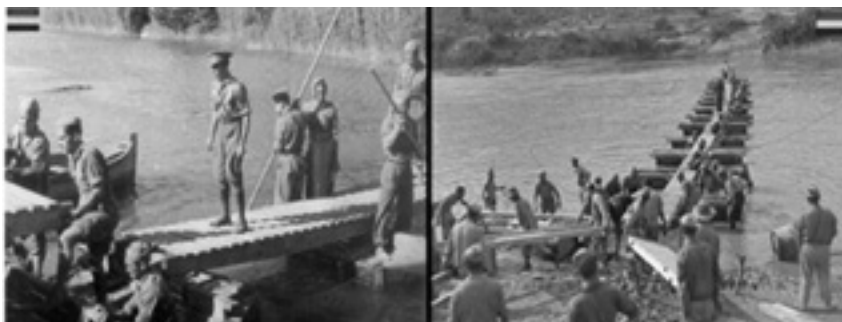
Trabajo de los pontoneros republicanos para el paso del Ebro en la segunda oleada.

Se va a consumar el paso del Ebro por fuerzas del V y XV C.E. al mando de Líster y Tagüeña, respectivamente, los Jefes mejor valorados del Ejército Republicano. Rápidamente entre la madrugada del 25 y el 26 de julio ambos C.E. se van a plantar en las puertas de Gandesa, principal objetivo de Modesto que comanda la operación como Jefe de la Agrupación Autónoma del Ebro, con las fuerza del XV C.E. en el que se hayan incluidas todavía las Brigadas Internacionales. Por otro lado el V C.E. de Líster está desarrollando su ofensiva más al sur avanzan van a llegar a Mora del Ebro y la Sierra Pandols.