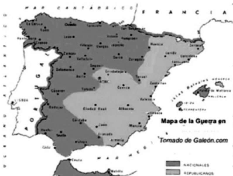
Mapa de la situación de las dos zonas: Sublevados (zona más oscura) y Republicanos (zona más clara) en Marzo de 1938.

A pesar de la propaganda Republicana sobre la toma de Teruel, el día 7 de enero, en una operación diseñada por el jefe de Estado Mayor Vicente Rojo y desarrollada por el Ejército del Levante del general Hernández