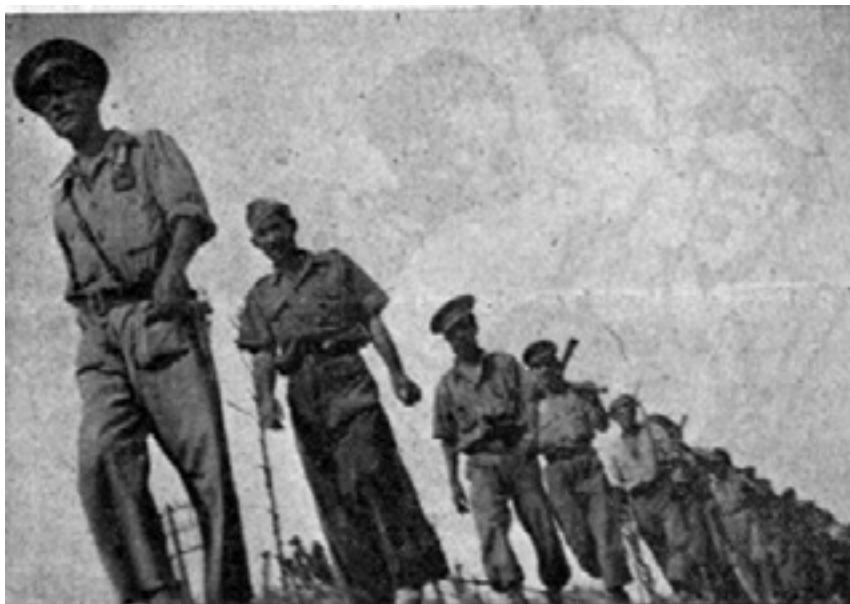
Hombres de la Compañía de Minadores Zapadores de la 24ª BMX, volviendo de los trabajos nocturnos de Fortificación en el Frente de Seseña. (Fuente de información: Victoria, Portavoz, de la 24 Brigada, Centro Documental de la Memoria Histórica de Salamanca).

en Colmenar de Oreja y Valgrande, los alojamientos de la tropa, así lo demuestran los partes de trabajo, prácticamente diarios, que emite el capitán de la compañía al Jefe de Estado Mayor de la Brigada, (AGMAV, C. 981,13,3/D 10 al 30). En muchas ocasiones se trabaja de noche para no ser detectado por el enemigo, sobre todo cuando se construyen refugios y pozos de tiradores.