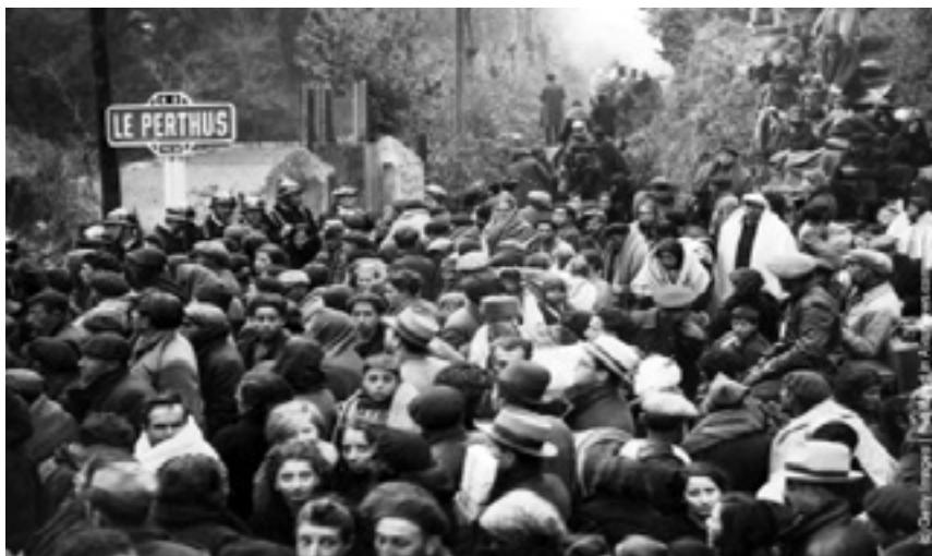
Imágenes del paso de la frontera de soldados mezclados con civiles

vagabundos...Se preguntó a los españoles qué llevaban en los macutos y en las bolsas de mano[...] tomaron las bolsas y las mochilas que contenían los efectos personales y los vaciaron en una zanja rellena de cal viva[.....] estaban rígidos como si hubieran vuelto de piedra; no entendían lo que ocurría” 74 .