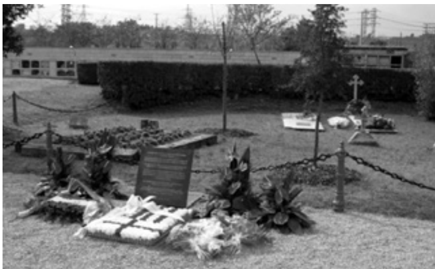
Monolito en Gandesa que recuerda a los muertos en la defensa de la República.

Independientemente del debate por el concepto de Memoria Histórica, tratado ya por los historiadores en numerosas teorías mediante una extensa bibliografía, lo que está, para nosotros, claro es que en los últimos años se ha ido consolidando el concepto de la Memoria de los campos de batalla y la puesta en valor del patrimonio material que dejan éstas. La batalla del Ebro, por su significado y transcendencia histórica, es equiparable, salvando las distancias, a batallas como las de Normandía o Satalingrado, y gracias a esta concepción se han desarrollado iniciativas públicas y privadas que, no solo han ido recuperando y catalogando los restos, sino que también, han abierto centros para poner en valor el patrimonio material de la batalla, siguiendo los modelos del Memorial de Caen, y el conjunto museístico y patrimonial de la batalla de Normandía. En el 2001 nace el Consorci Memorial del Espais de la Batalla del Ebro (Comebe), con el apoyo de las administraciones locales y del Gobierno de la Generalitat. Se crearon cinco centros de interpretación en los cuales los visitantes puede adquirir la información necesaria para interpretar los acontecimientos que marcaron el desarrollo de la batalla. Por otro lado están los espacios históricos, que permite al visitante pasear por los lugares