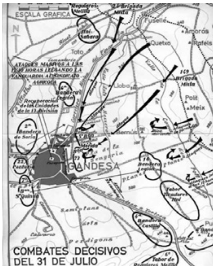
Ataques de la 24ª Brigada Mixta en Gandesa finales de Julio de 1938. (Fuente: La Batalla del Ebro, Lluís M. Mezquida I Gené).

La 24ª Brigada Mixta con sus batallones, estaba situada en la parte más al norte de Gandesa, y debería arremeter contra las tropas rebeldes directamente por la carretera de Corbera, pero de nuevo vuelve a fallar la artillería, la baterías del XV C.E. republicano son insuficientes para que el plan resulte un éxito. A las 06:00 del día 30 van a entrar en las zonas urbanas las Brigadas 23 y 149 arrollando a las fuerzas de la Legión. Los combates son encarnizados y casi cuerpo a cuerpo, alcanzando las primeras casas,