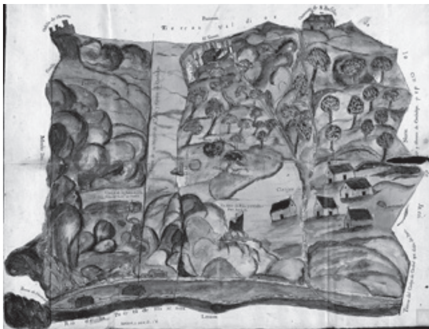
Mapa para el apeo de las tierras de Cazalla y del Campillo de Arenas Año 1778

Cuatro años más tarde, en octubre de 1786, la villa de Campillo de Arenas, no conforme con el resultado del pleito anterior, inicia otro pleito en Rebista . 11 En un intento de dejar fuera de la propiedad de Conde, la Dehesa de Cazalla.