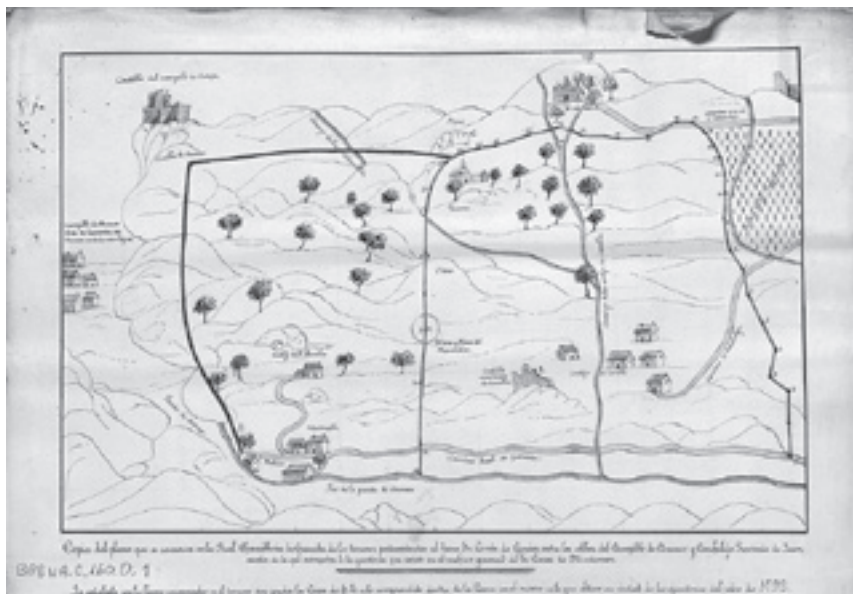
Mojonera deslinde de Cazalla