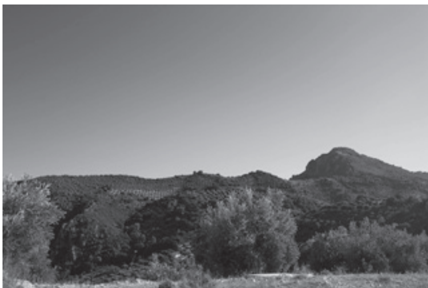
Vista actual de la antigua Dehesa de Cazalla