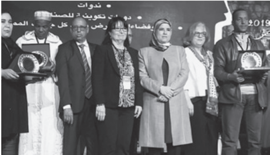
Figura 2: fotografía tomada en Marrakech durante el Octavo Encuentro sobre la Preservación de los Oficios Artesanales Marroquíes en la que se puede apreciar en el centro a la Coordinadora del Plan Nacional de Salvaguarda del Patrimonio Cultural Inmaterial, junto a la Secretaria de Estado para la Artesanía marroquí y la Directora de la Oficina Unesco para el Magreb.

El último encuentro tuvo lugar el pasado 12 de julio, en el Ministerio de cultura, en Madrid, con motivo de la primera reunión formal de expertos y representantes de los países interesados para impulsar esta candidatura.