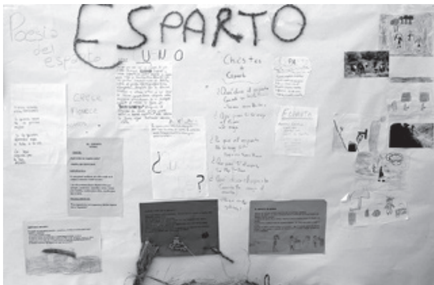
Figura 3: Mural del Esparto en el Colegio Público Virgen de Nieves de Sesma.