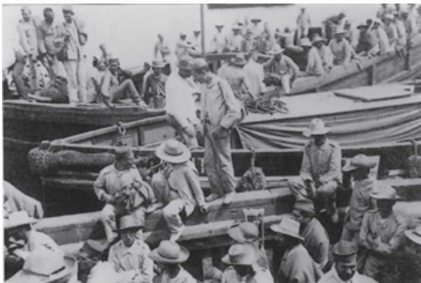
Repatriación de enfermos y heridos procedentes de Cuba. (Anónimo, La Coruña, 1897. Archivo-biblioteca de la Cruz Roja Española).