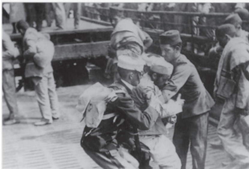
Soldado repatriado ayudado por miembros de la Cruz Roja española al desembarcar en el puerto de Santander.